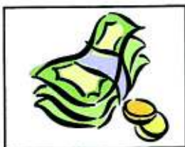
Denaro in contanti