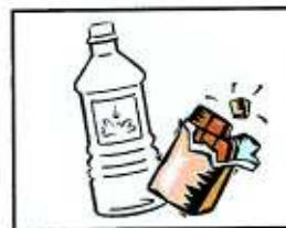
Acqua in bottiglia, piccole provviste