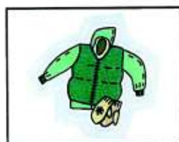
Vestiti adeguati e di ricambio