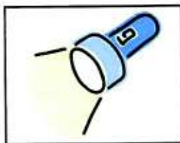
Torcia elettrica, batterie di scorta