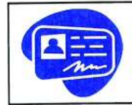
Documenti di identità e altri documenti importanti