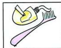
Necessario per l'igiene personale