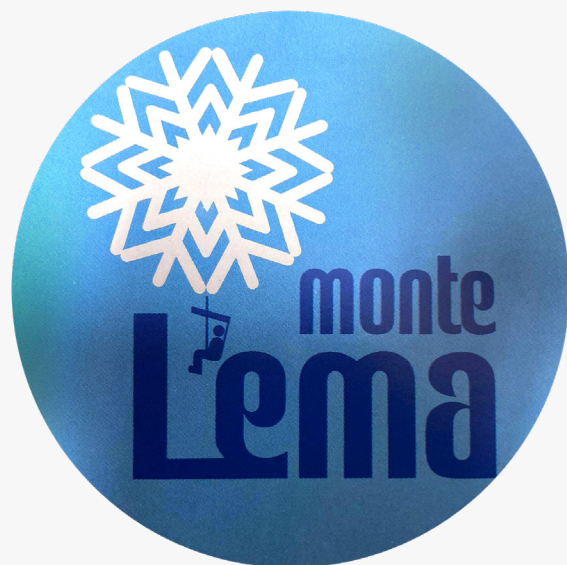
Il primo logo