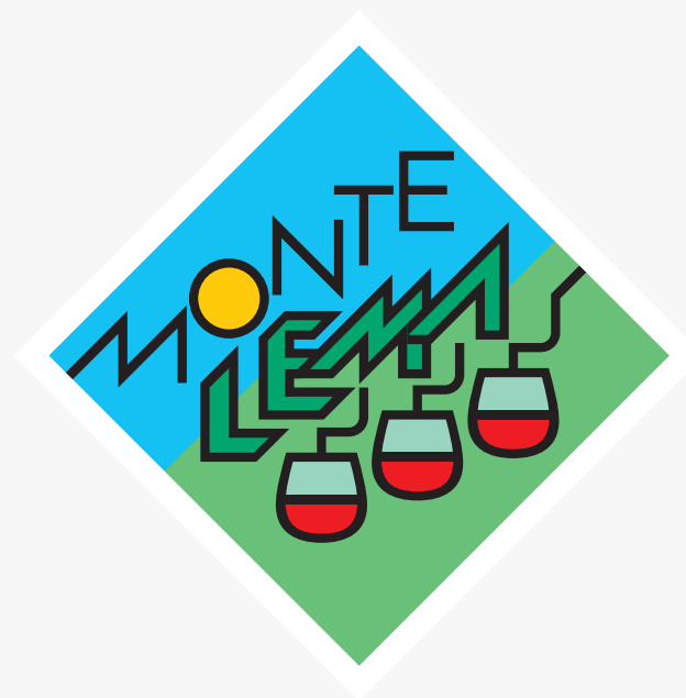
Il logo attuale

Il primo logo, del quale purtroppo esistono poche informazioni, è stato realizzato nel 1952. All'epoca era presente una seggiovia.